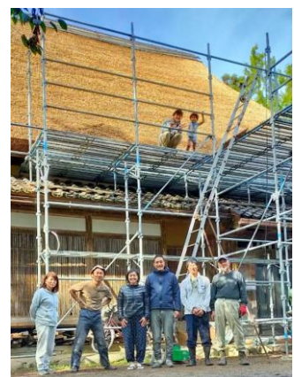
右：茅葺古民家再生の様子

○江戸時代に建てられた茅葺屋根の古民家を、宿泊施設として再生。囲炉裏や五右衛門風呂などの昔ながらの生活を体験できるほか、旧農家の敷地を活用した様々な体験プランを提供する。 ○能登産の米や野菜、魚介類を活用した食事の提供や、地域の飲食店への送迎を行う。