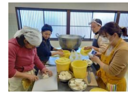
体験メニュー開発