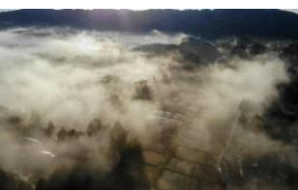
農業遺産の田園風景