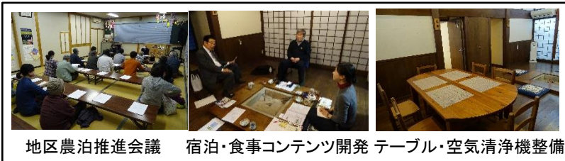
地区農泊推進会議