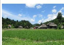
萩ノ島環状集落・かやぶきの宿