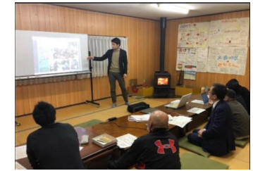
地域のワークショップ