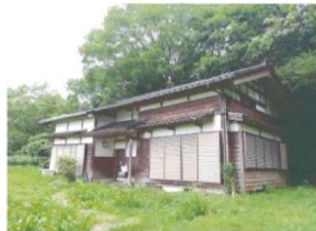
古民家活用宿泊施設