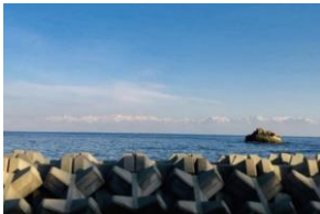
富山湾越しに観る立山連峰