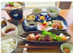
山海の食材を利用したランチ