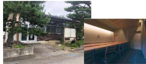
旧郵便局活用飲食施設(イメージ)