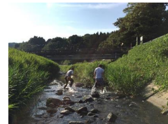
清流で鮎とり体験