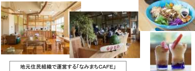
地元住民組織で運営する「なみまちCAFE」