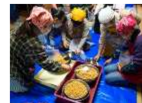
味噌づくりイベント