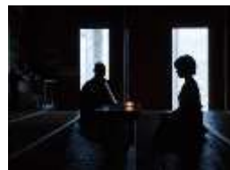
明通寺での朝の瞑想