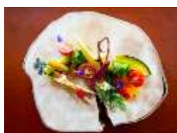
提供する「精進料理」の例