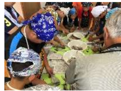
地元食材を活用した「イカ裂き体験」