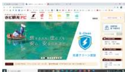
さど観光ナビ(PR動画)