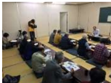
リスクマネジメント研修