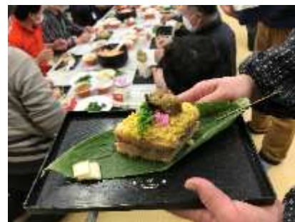
地元食材を活用した「笹舟寿司」