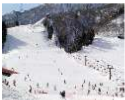
タカンボースキー場