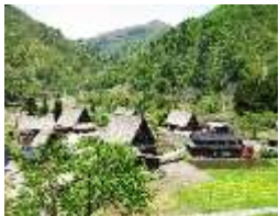
菅沼合掌造り集落