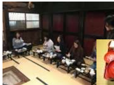
地元おかあさんが作る報恩講料理