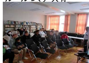
インバウンド推進会議