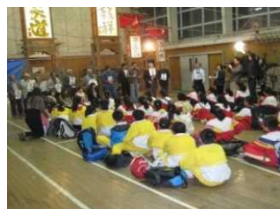
農家民宿で修学旅行を受入