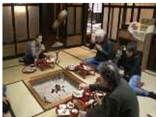
外国人旅行者の受入れ