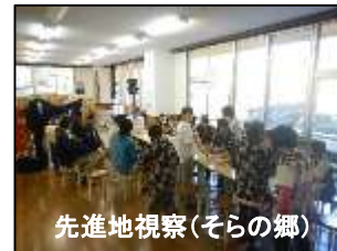
先進地視察(その郷)