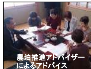
農泊推進アドバイザーによるアドバイス