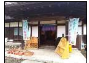
いじら・焼き畑食堂