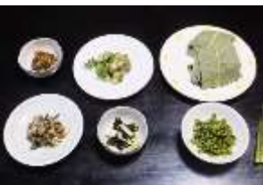
季節の山菜、味見のお米