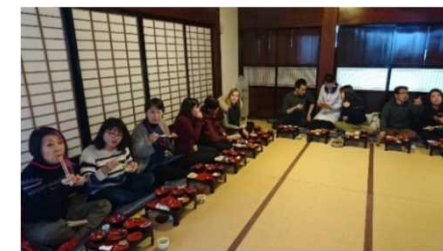
海外メディアツアー(食事)