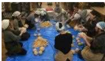
暮らし体験(味噌造り)