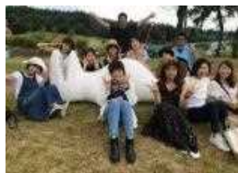
暮らしとアート体験