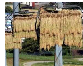
天空米(スキー場リフトへのハザ掛け)