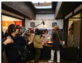
モニターツアー (テレビ放映用取材)