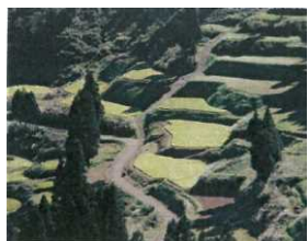
棚田(吉里区・岩ノ下)