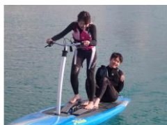
ペダル式サップの導入