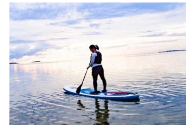
里海体験プログラム