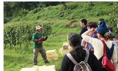
里山体験プログラム