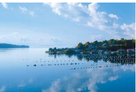
穏やかな内海の風景