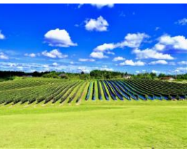
能登ワインの醸造用 ぶどう畑の風景