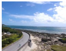
ドローンを使った動画作成