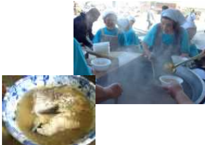
ヒスイ海岸「たら汁祭り」