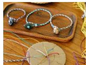
ヒスイのプレス作り体験