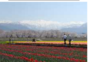
あさひ舟川の花畑