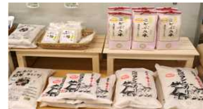
地場産品(魚沼産こしひかり)