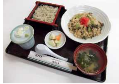
開高めし・せいろそば