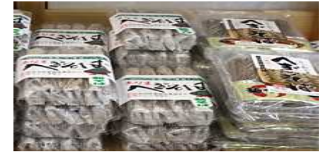
地場産品(へぎそば)