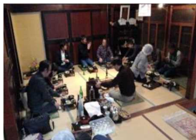
自然栽培体験ツアー