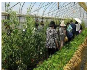
自然栽培体験ツアー