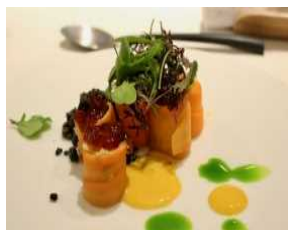
自然栽培農産物 を利用したメニュー