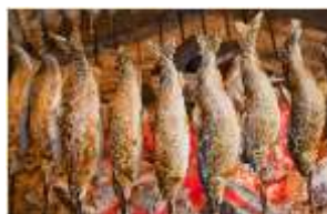
川口やな場の鮎料理