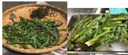
地域で採取した山菜