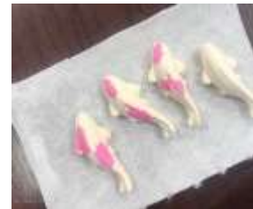
新商品：干菓子「鯉日和(こいびより)」