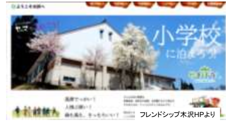
廃校活用の宿泊施設「やまぼうし」