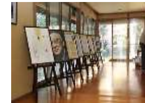
郷土の酒博士 (坂口 謹一郎)