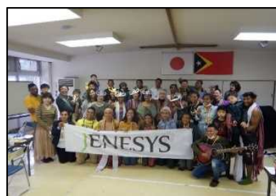
東ティモールの大学生等