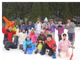
冬のモニターツアー