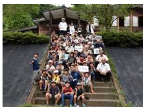
夏のモニターツアー