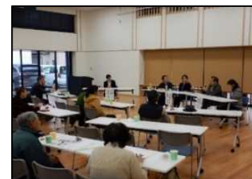
農家民宿フォーラム