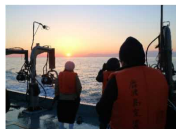
ファムトリップで見られた朝日