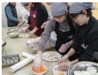
かぶら寿司づくり体験