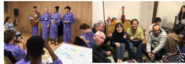
留学生等によるワークショップ・地域住民との交流会