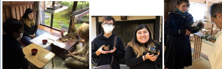
留学生等による越前漆器(絵付け)、神事体験

○留学生を中心に、当地域に滞在し、伝統産業や伝統文化、伝統食、地域住民との交流などの体験談について、SNSにて積極的に発信し、河和田地区をPR。