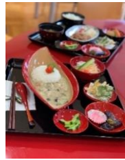
地元食材と漆器を使った料理の提供