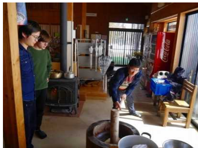
インバウンドモニターツアー