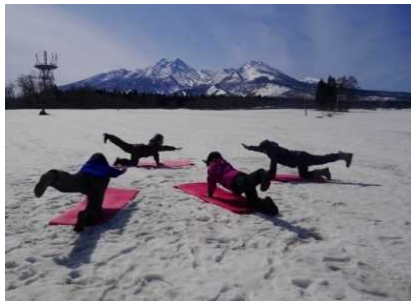
ウエルネス体験(ヨガ)