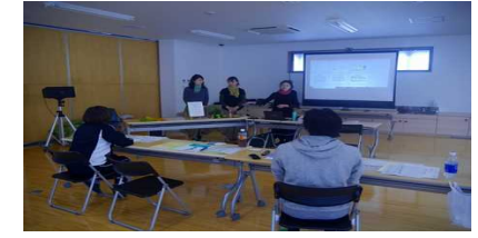
森林ヨガ基礎講座