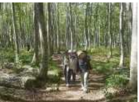
森林セラピーロード