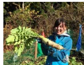
だいこん収穫体験