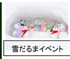
雪だるまイベント