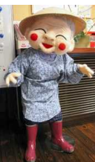
地元キャラのハクさん→