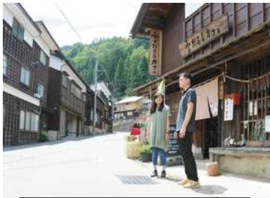
白峰の歴史的なまち並み