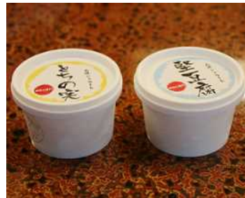
地元食材を使ったデザート