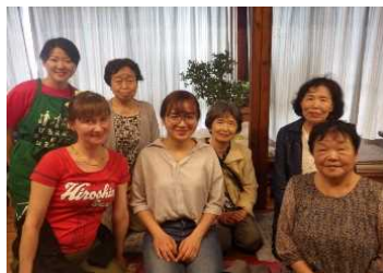
ランチミーティング