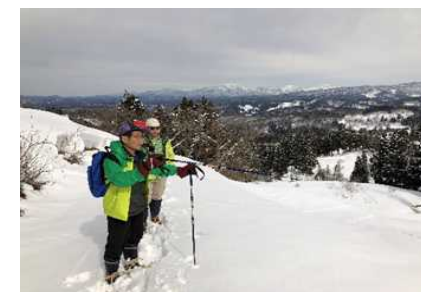
スノーシュー体験教室