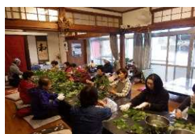
くろもじ茶作り体験教室