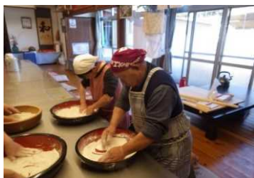
そば打ち体験教室