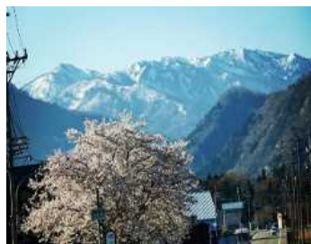
白山の壮大な景観