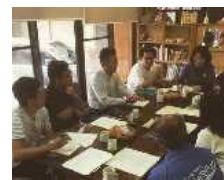
外国語表記の実施