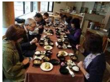
スローフード(料理)の開発