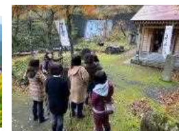
モニターツアーの様子(史跡散策)