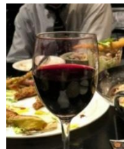
山ぶどうワインの農泊活用