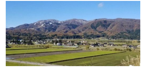
医王山と太美地域の農産物活用