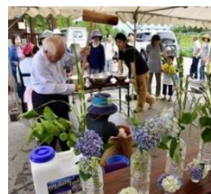
農泊イベント創出