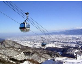
イオックスアローザ・ゴンドラ