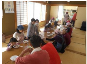
地域食材での「食」の提供