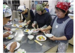
山ぶどう料理体験