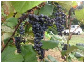
山ぶどう畑の観光活用