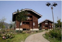
イオックスアローザ・コテージ