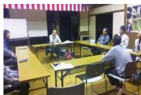
スキルアップセミナー