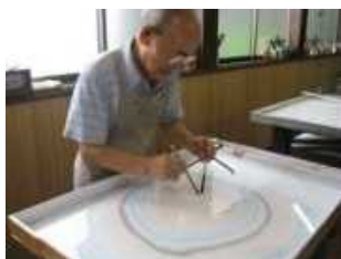
福井県指定無形文化財 「墨流し」