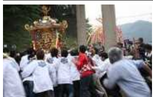
神と紙の祭り「渡り神輿」