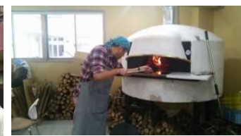
農家レストラン加工品開発