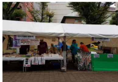
みなと区民まつり