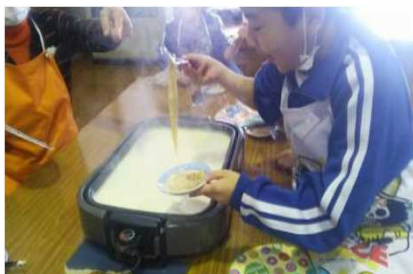
体験メニューの開発