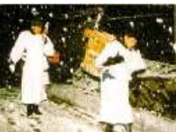
気多の鷺祭の習俗 (重要無形民俗文化財)