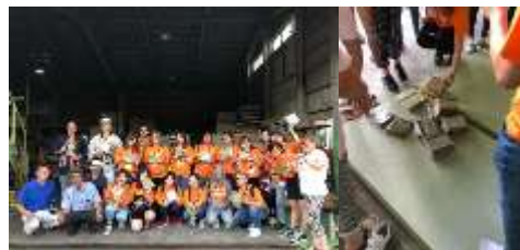
ミニ畳づくり体験