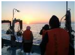
定置網漁乗船体験