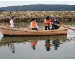
三室の船大工・船小屋