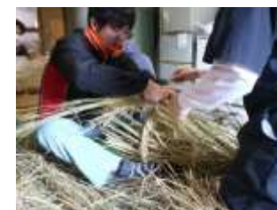
鵜様道中体験プログラム