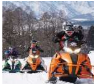
スノーモービル体験