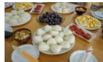
地域食材を活用した「食」の提供