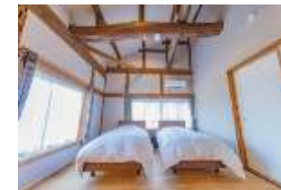
古民家を宿泊施設「雪郷ロッジ」に改修