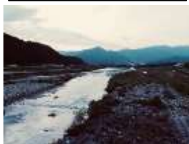
一級河川 九頭竜川