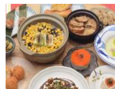
地域食材を活用した「食」の提供