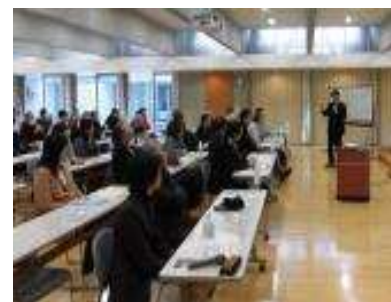
農家向け高収益セミナー