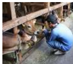
ジャージ牛酪農体験