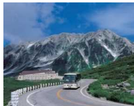
立山黒部 アルペンルート