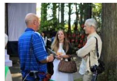
海外メディア招聘