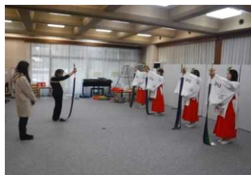
体験コンテンツ(巫女体験)