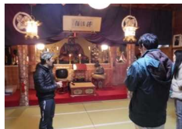
立山信仰コンテンツ開発