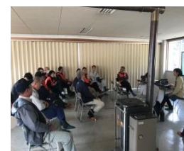
ワークショップの開催