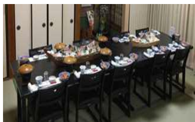
新鮮な地元食材を使った料理