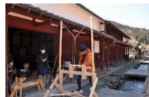
グリーンウッドワーク体験