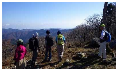
熊川トレイル体験