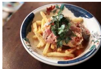
地域食材のレシピ開発