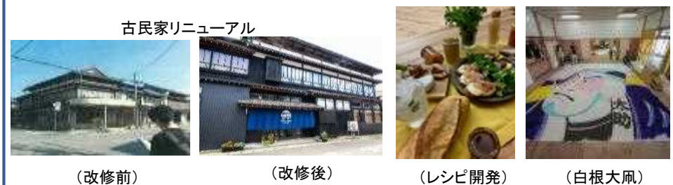
古民家リニューアル