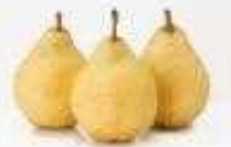
西洋梨「ル レクチェ」