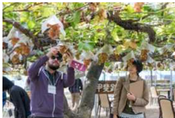
花粉付け～フルーツ狩り