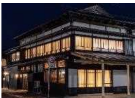
宿泊施設 ゲストハウスグーグー