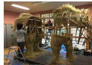
わらアートの制作