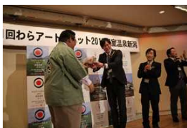
わらアートサミット