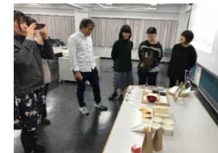
商品パッケージのデザイン検討