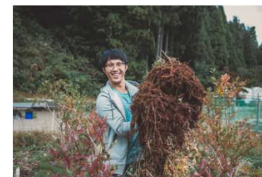
整備した農園での収穫体験