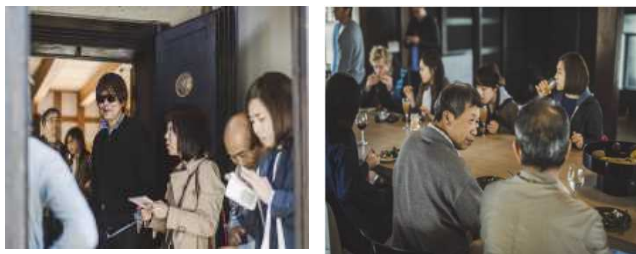
メディアツアー様子