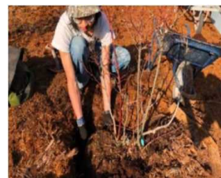
耕作放棄地の整備