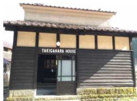
石蔵を改修した宿泊施設