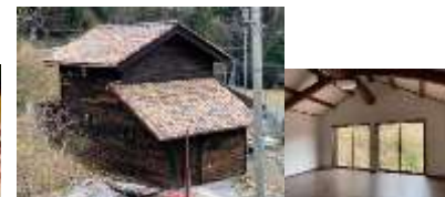
宿泊施設「ライダーハウス」