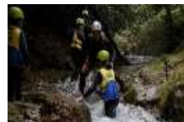
キャニオニング体験