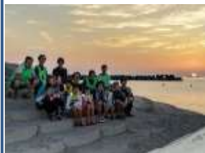
ナイトシュノーケリング体験