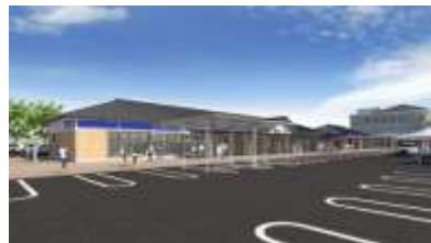
道の駅たがみ(2020年10月開業予定)