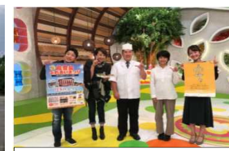
作成したポスターを活用して、地元のテレビ局でPR活動