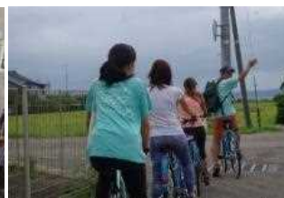
サイクリングガイドツアー