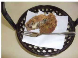
開発したイノシメンチ