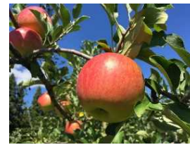
ひみりんご収穫体験