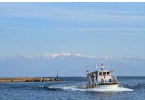
氷見沖クルージング