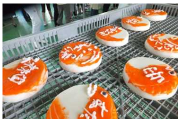
細工かまぼこ絵付け体験