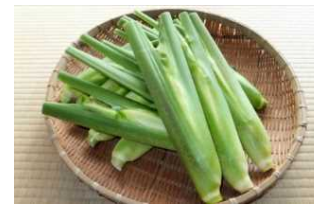
マコモタケ収穫体験