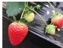
氷見いちご収穫体験