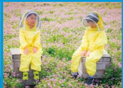
蜜源となるれんげ畑