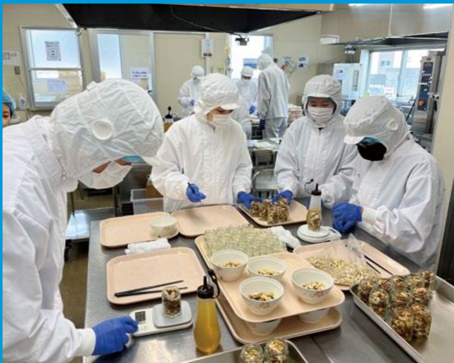
障がい福祉施設によるハチミツ商品製造