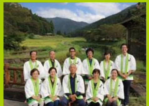
伊自良・食と農推進協議会集合写真