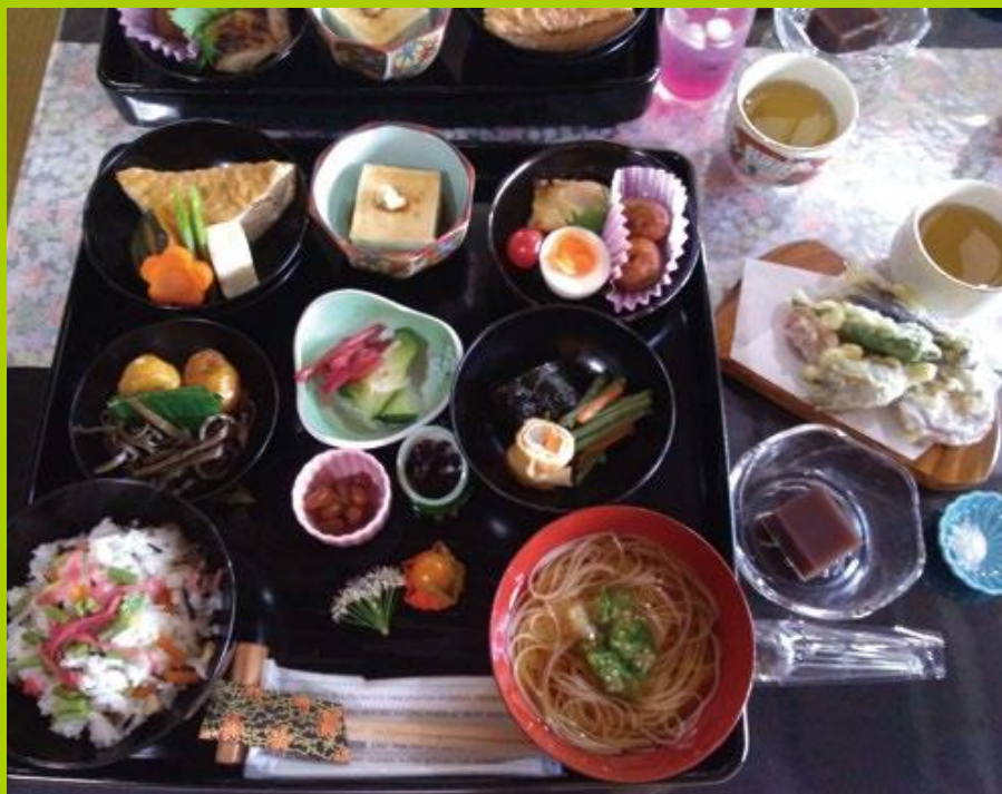
山郷の食のおすそわけ