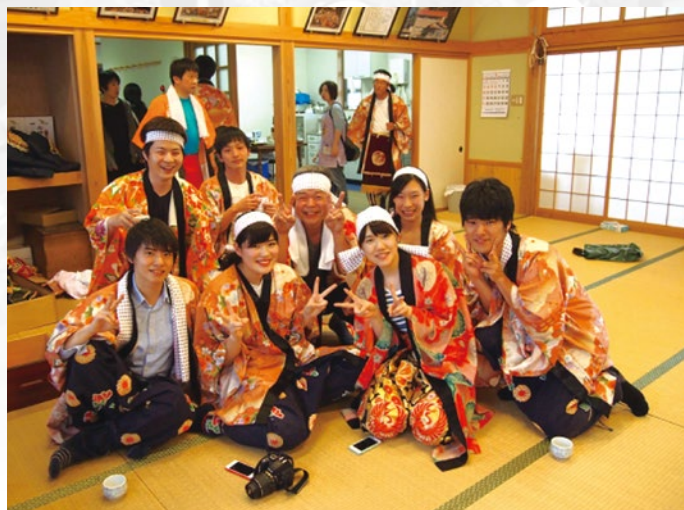
獅子舞の衣装をつけて、地域の祭礼に参加