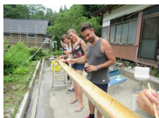
外国人観光客がこの山村で流し素麺に初チャレンジ