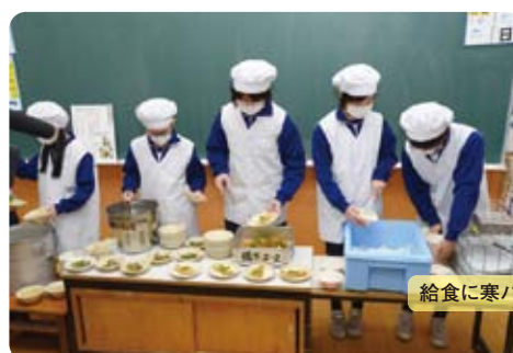
給食に寒ハギフライの提供