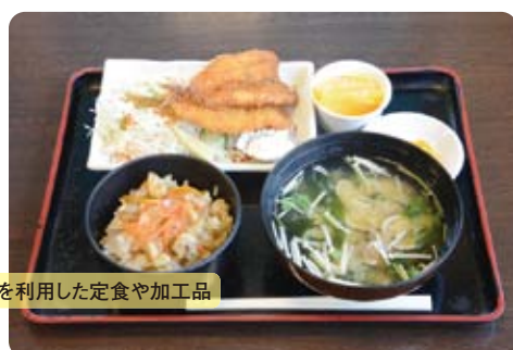
ウマヅラハギを利用した定食や加工品