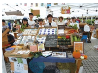
青山ファーマーズマーケットで利賀の産物出展