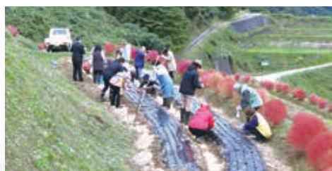
にんにくを植付け次年度につなぐ