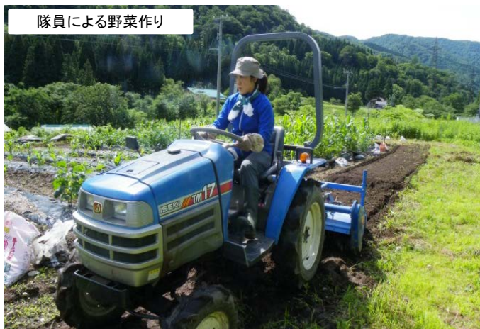
隊員による野菜作り