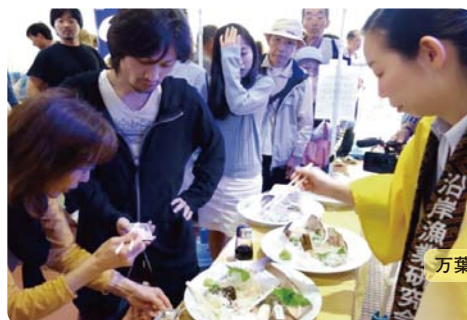
万葉カレイの試食会