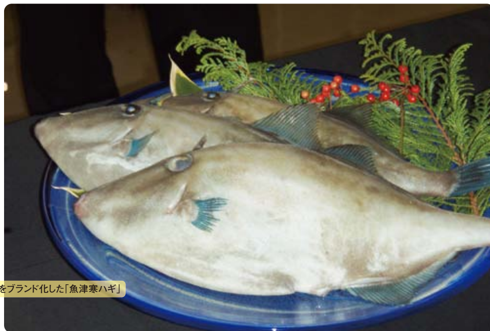
ウマヅラハギをブランド化した「魚津寒ハギ」