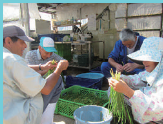
収穫した野菜の選別作業