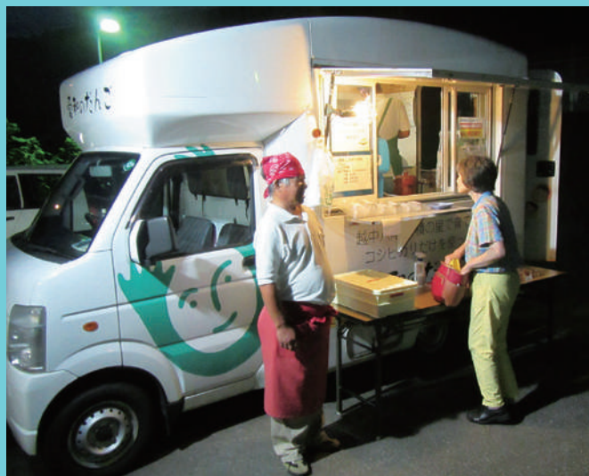
製造した加工品の移動販売