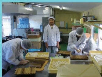
収穫したコシヒカリでおだんごの製造