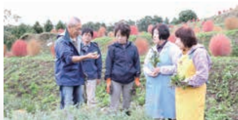
ハーブの利用方法等の説明を受ける参加者