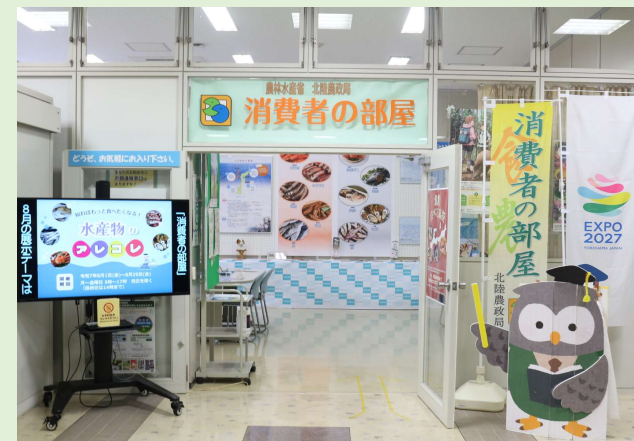
「消費者の部屋」入り口