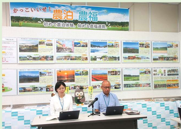
食の知っ得（とく）講座(オンライン配信)