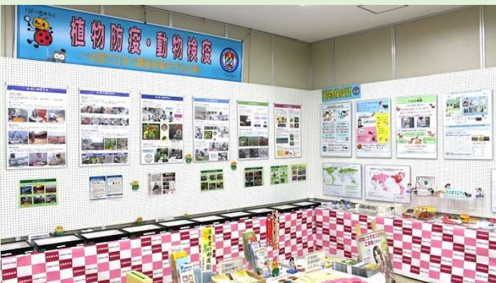
「消費者の部屋」展示風景