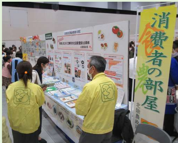
移動消費者の部屋

より多くの方々に対して情報 を提供するため、イベント会場 等において、パネルの展示、各 種資料等の配布及び消費者相談 窓口の設置を行っています。