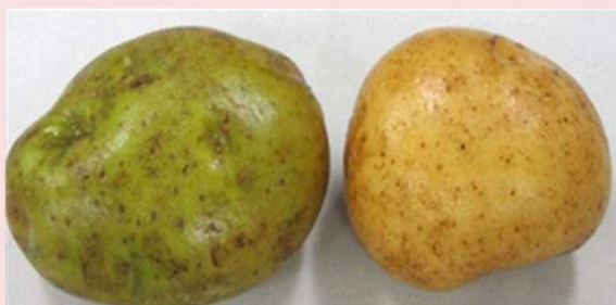
緑色に変わったジャガイモ(左)と 色が変わっていないジャガイモ(右)