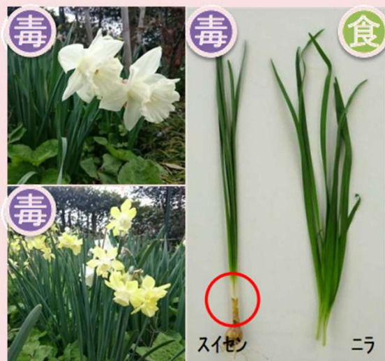
↑園芸種のラッパスイセン ↑スイセンとニラの比較