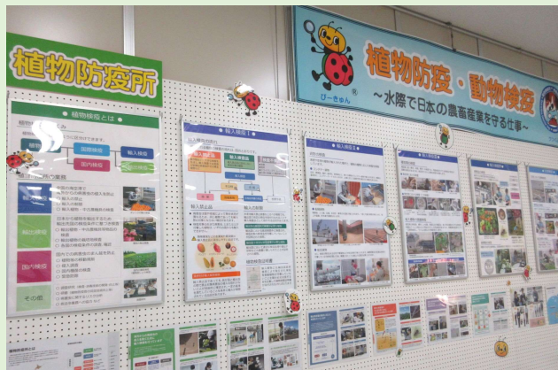
「消費者の部屋」展示風景