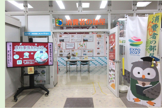
「消費者の部屋」入り口