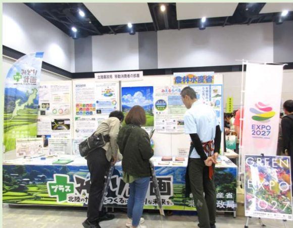
移動消費者の部屋

より多くの方々に対して情報を提供するため、イベント会場等において、パネルの展示、各種資料等の配布及び消費者相談窓口の設置を行っています。