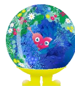
GREEN×EXPO 2027 公式 マスコットキャラクター トゥンクトゥンク