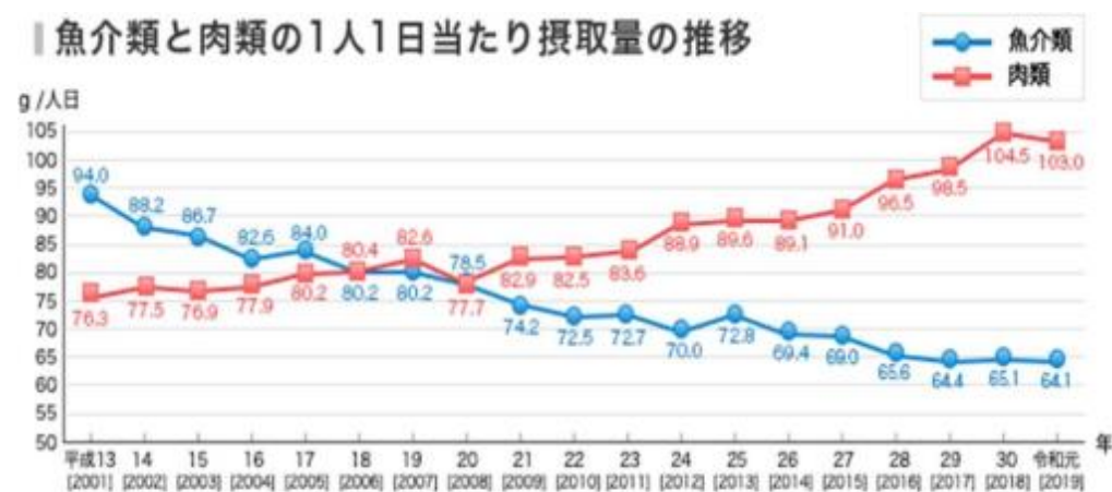
魚介類と肉類の1人1日当たり摂取量の推移