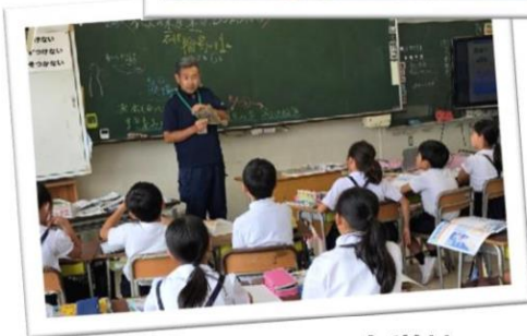
小学校での出前授業