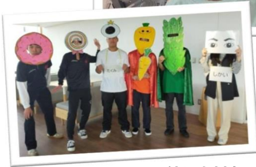
幼児を対象とした食育劇