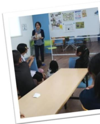
英会話教室での 食育セミナー