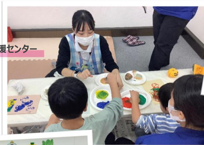
児童発達支援センター での活動