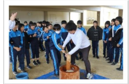
小学校もちつき体験授業