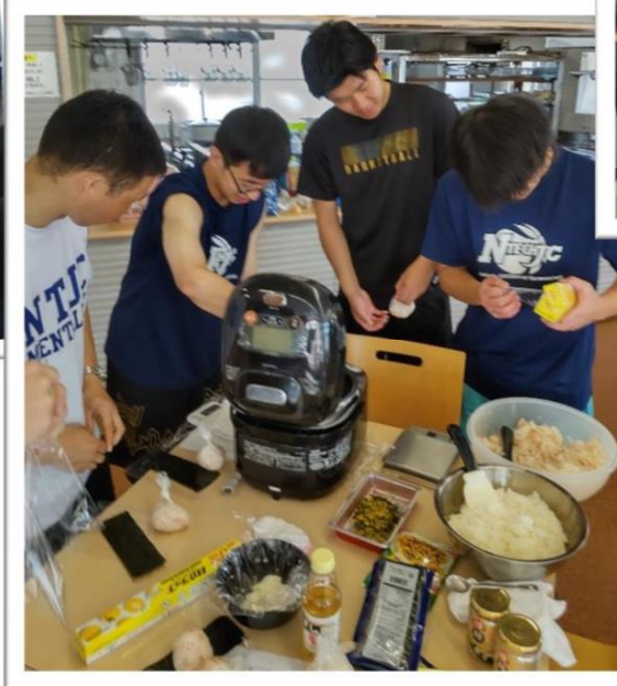
バスケットボール部へのセミナー