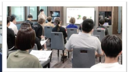
クリニックでのセミナー