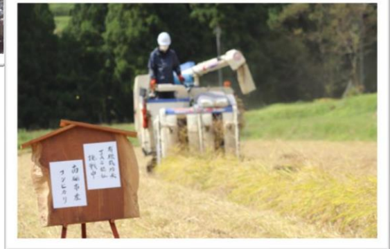
五箇山米プロジェクト