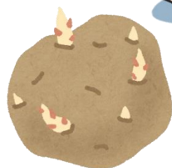
芽がでたじゃがいも