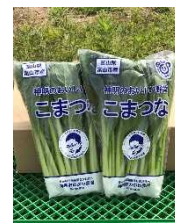
各川代表の顔がプリントされたパッケージ