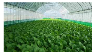
各川さんのハウス内で生育した小松菜