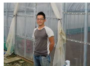
神明おのがわ農園の各川代表