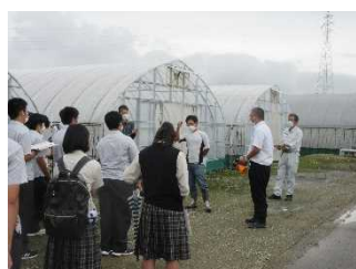
見学に訪れた高校生に説明する各川代表(右から3人目)