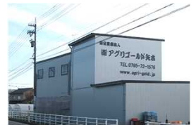
有限会社 アグリゴールド矢木