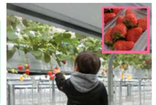
イチゴの摘み取り体験